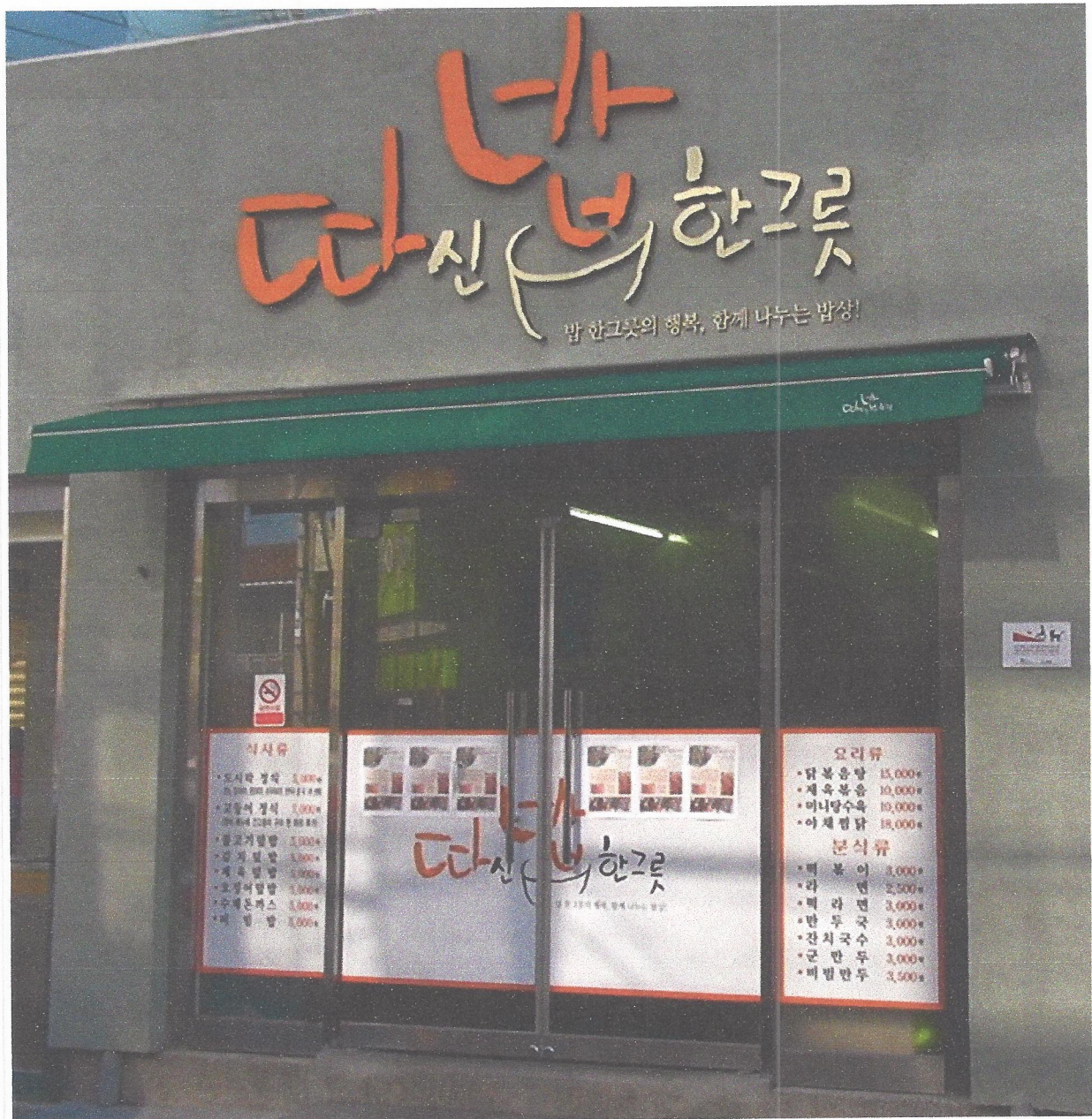
대구쪽방상당소가 있는 서구 평리동 '희망드림센터' 1층에 자리한 '따신밥한그릇'. 식당에서 벌어들이는 수익은 쪽방주민들의 식사를 지원하고 일자리를 창출하는 데 쓰인다.

노숙인복지는 가장 후발주자 “대학원까지 졸업하고 왜 그러나” 쪽방상당소 사회복지사가 가장 설득하기 힘든 사람은 바로 자신의 가족